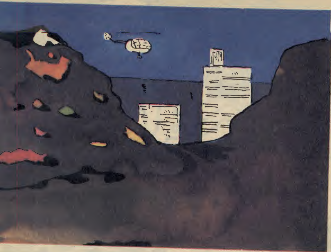
Ilustrował: Julian Bohdanowicz

szony nieruchomo nad ziemią, jego galaretowate ciało zdeformowane przez zewnętrzną siłę ciężenia, Hhil ze znużeniem obserwował poruszające się w dole pojazdy. W szczególnie sprzyjających warunkach wśród pozornie doskonale uporządkowanego ruchu udawało mu się odróżnić oddzielne ogniska niekonsekwencji, świadczące o różnych sposobach widzenia. Zawsze nietrwała równowaga wewnętrzna Hhila była teraz dodatkowo naruszona przez kontrastowe oświetlenie, utrudniające synchronizację jego dwu osobowości. Sir Edward skierował wózek z murawy na ścieżkę prowadzącą do bramy. Jessemu udało się wyminąć kolejną przeszkodę. Piaszczysta droga przed nimi wydawała się zupełnie biała. Było gorąco i Jesse z przyjemnością myślał o zimnym napoju i odpoczynku w klubowym pawilonie.